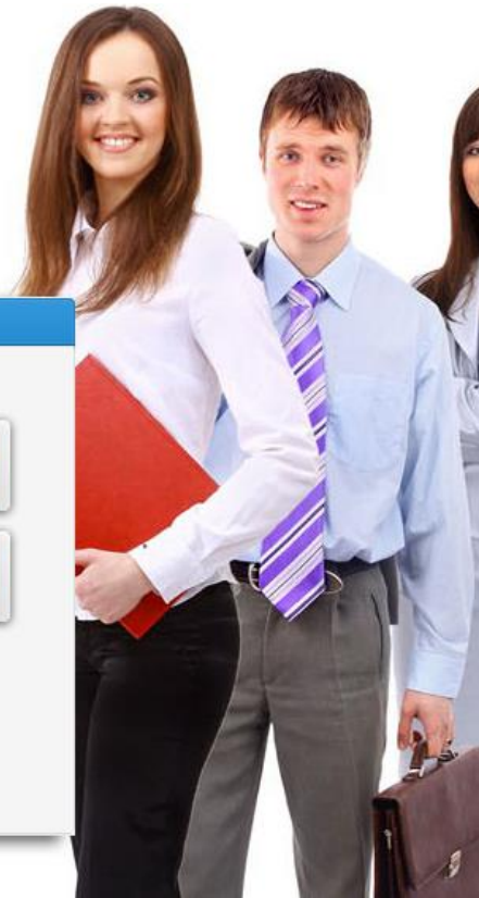
Figura No. 1 Acceso al Sistema